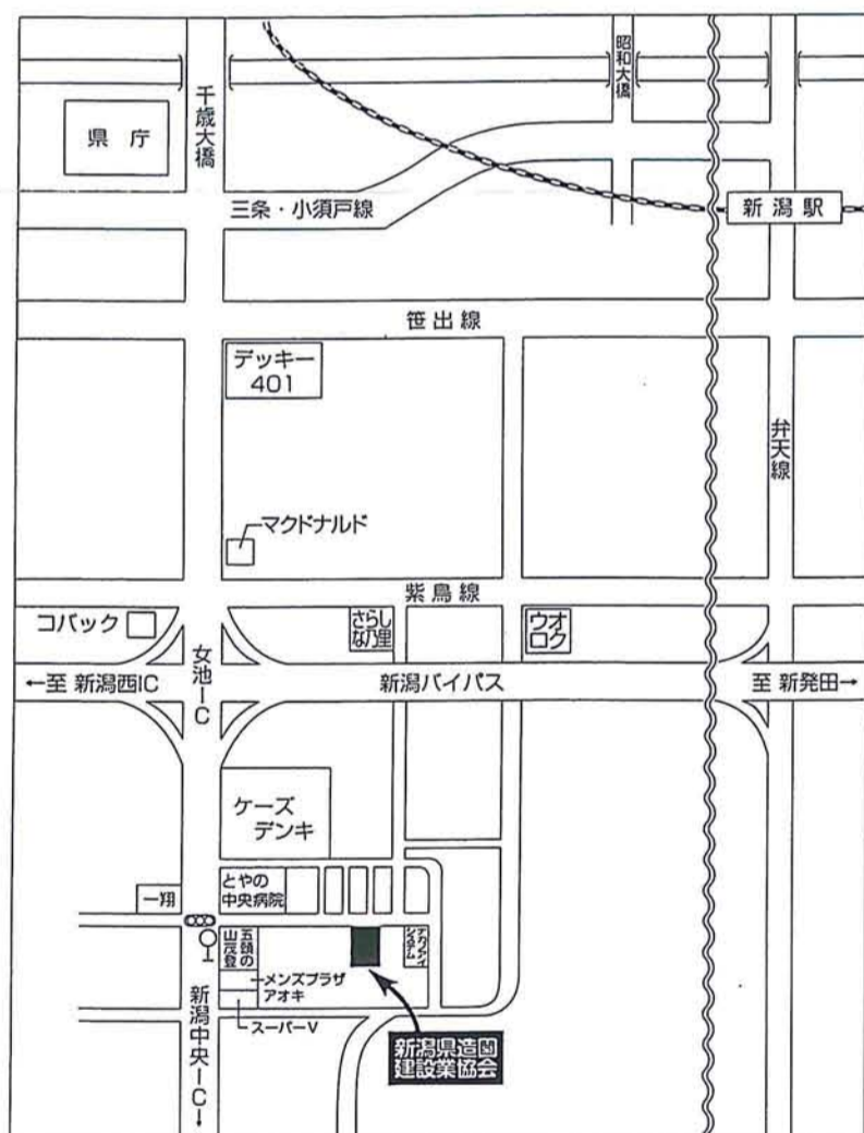
学科予備講習会会場案内図

交通：バス 新潟駅南口 女池愛宕行乗車 新潟市民病院行 江南高校前下車 (徒歩7分) とやの中央病院前下車 (徒歩5分)